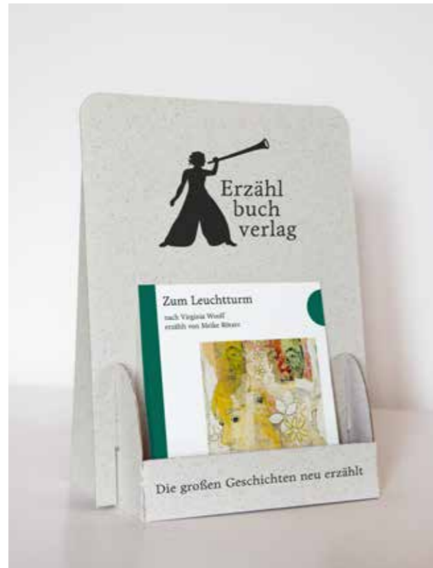
Im Innenteil der Geschenkkarte finden Sie den QR-Code zum direkten Download der Erzählung.